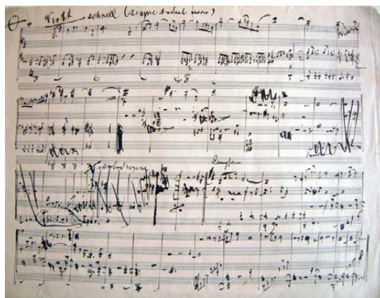
馬勒離世前快速完成了第九交響曲，可惜未能等及作品首演便已辭世。

就在1907年的夏天，馬勒被逼離開他曾經引以為傲的維也納國家歌劇院。同年，他年幼的女兒因病離世，而最致命的，是他亦被診斷心臟出現嚴重毛病。第六交響曲，彷彿預告了馬勒的命運。